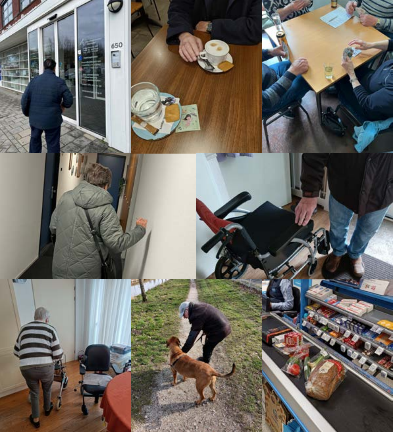
Figuur 2. Foto-impresie van de cases

Factoren die van invloed zijn op de seniorvriendelijke ervaringen van deelnemers kunnen worden ingedeeld in vier hoofdthema's: steun van het sociale netwerk, fysieke beperkingen, financiële situatie en coping strategieën (Figuur 3).