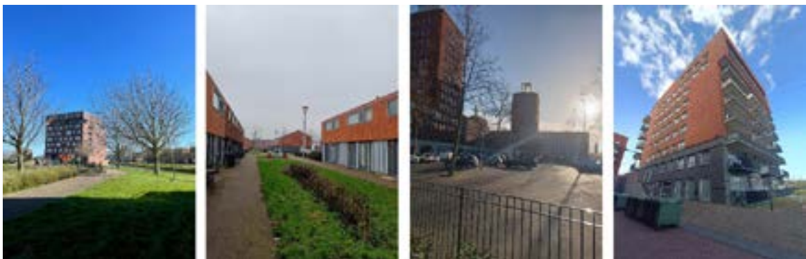
Figuur 1. Impressie van de bebouwde omgeving in de wijk Leidschenveen-Ypenburg.

Ypenburg heeft 26.780 inwoners, waarvan 8,7% 65 jaar en ouder is. Leidschenveen heeft 20.676 inwoners, waarvan 10,7% 65 jaar of ouder is, en het aandeel oudere inwoners kent de afgelopen vijf jaar een stijging van 2,9% (jb Lorenz., 2022).